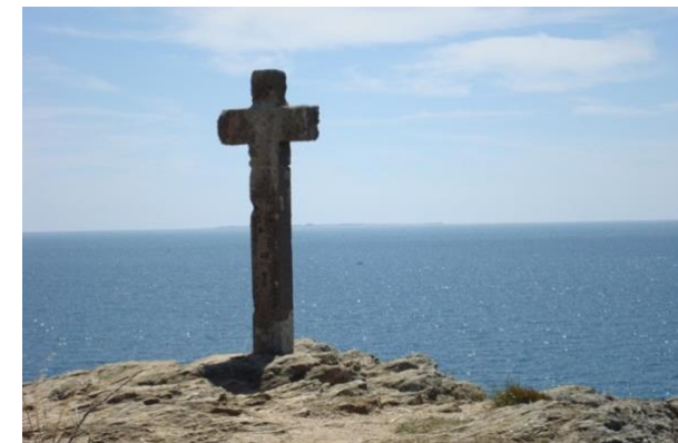
Retour au calme dans un cadre naturel et exceptionnel